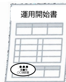
運用開始書一式 (消防署の登録印付き)