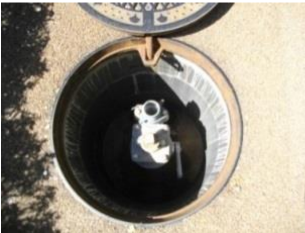
地下に埋設された消火栓の内部

大規模な地震が発生した場合、同時に多数の火災が発生し、大きく燃え広がるおそれがあります。また、地震の影響で消火栓の配管が壊れ、消火栓が使用できなくなることが予想されることから、防火水槽が必要不可欠となります。