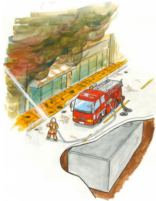
防火水槽活用イメージ