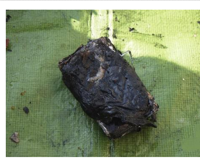
写真 1-3 潰れて燃えた充電式電池