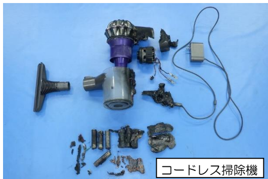
写真 2-1 焼損したコードレス掃除機の状況

1階にいた建物の住人が、上階で大きな音がしたことから各階を確認したところ、3階のベッド付近から炎が上がっているのを発見したため、119番通報をしています。