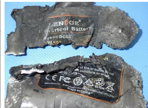
写真 2-3 焼損したバッテリーパック②（赤丸）非純正品