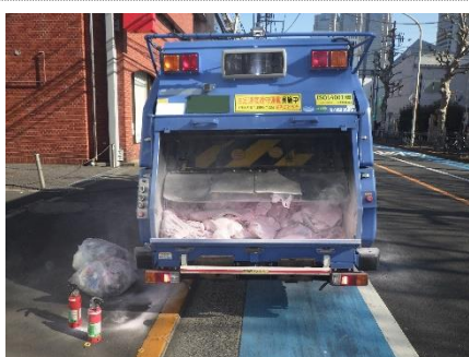
写真 1-1 焼損した清掃車

作業員は、路上で可燃ごみ回収作業中に後方の荷箱内から煙が出ているのを発見し、119番通報をしています。