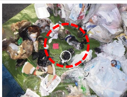
写真 1-2 荷箱内の燃えたごみ