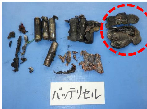
写真 2-2 焼損したバッテリーパック①