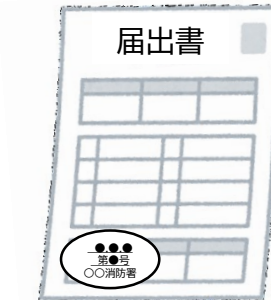
届出書の副本 (消防署の登録印付き)