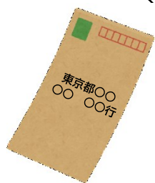
返信用の封筒 (切手付)