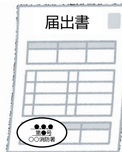
届出書の副本 (消防署の登録印付き)