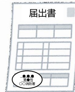
届出書の副本 （消防署の登録印付き）