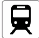
鉄道/鉄道駅 Railway/Railway station 철도/철도역 铁路/铁路站