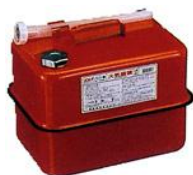
ガソリンの貯蔵に適した容器の例 (金属製容器であることが必要)