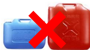
ガソリンの貯蔵に適さない容器の例 (樹脂製容器は火災危険性が高い)