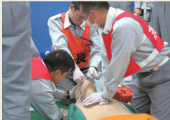
▲ 救急救命士就業前研修