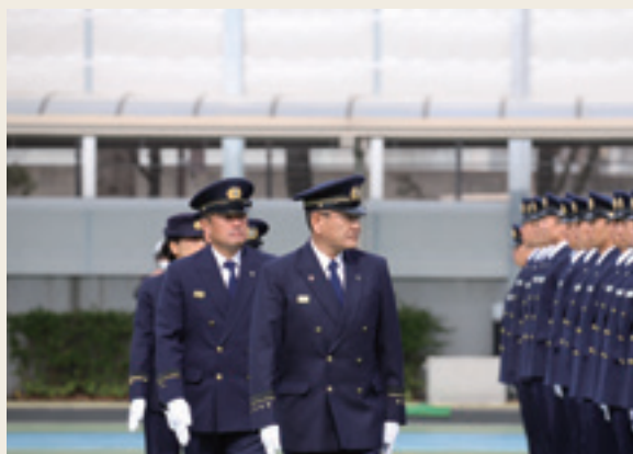
▲ 人員、姿勢、服装等の点検