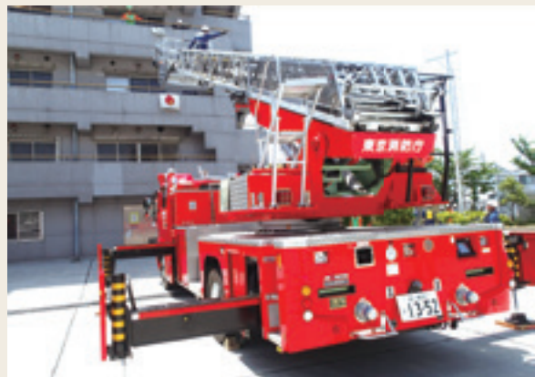
▲ 特別操作機関技術研修