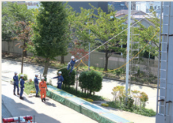
▲ 特別救助技術研修