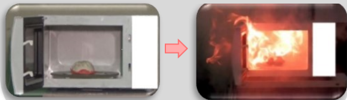
700Wで5分加熱したもの