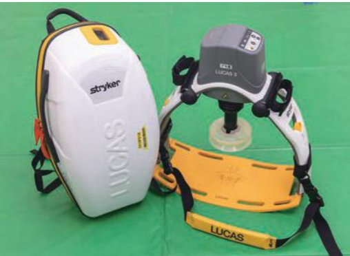
▲自動式心マッサージ器

救急現場から病院に到着するまで、継続した心臓マッサージを可能とする資器材です。令和5年度から全救急隊に順次配置しています。