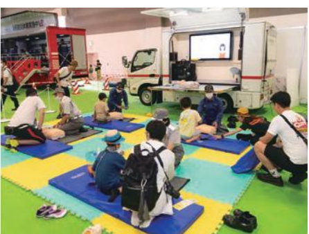
▲東京国際消防防災展2023での応急救護訓練