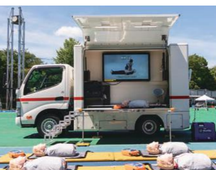
▲展示台やモニターを内蔵

イベントなどで応急救護訓練をすることができる車両です。心肺蘇生の訓練ができる人形や、訓練用AEDなどを積載しています。