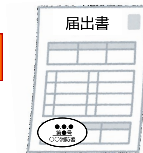
届出書の副本 (消防署の登録印付き)