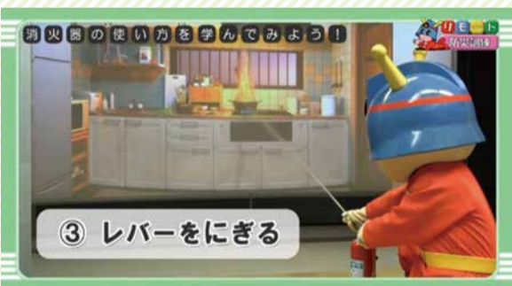
リモート防災訓練:キュータと学ぼう! 消火器の使い方

消火器の使い方、避難のしかたなどを分かりやすく説明しています。防災訓練の予習・復習に活用してください。