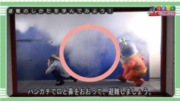
リモート防災訓練:キュータと学ぼう! 避難のしかた