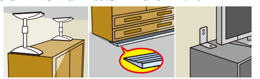
ポール式 ストッパー式 L型金具