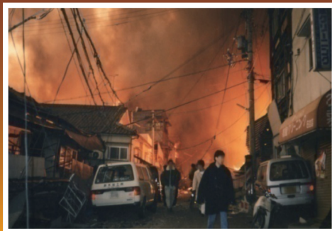
(平成7年 阪神・淡路大震災)