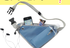
小物からペットボトルまでまとめて収納! ウォーキングポーチ