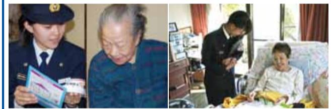
— 消防職員による防火防災診断の様子 —

東京消防庁では、民生児童委員など地域の皆様と連携して、高齢者や身体が不自由な方のお宅を訪問し、防火防災に関するアドバイスを行っています。