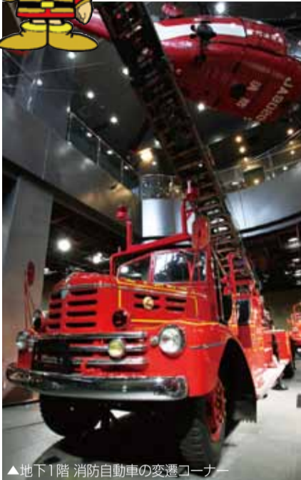
▲地下1階 消防自動車の変遷コーナー