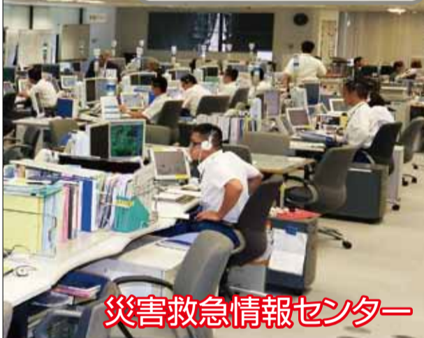
災害救急情報センター

現場に早く到着するためには、住所や災害の内容などの正しい通報が必要なんだ。落ち着いて通報してね!