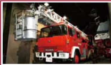
貴重な消防自動車がずらりと!