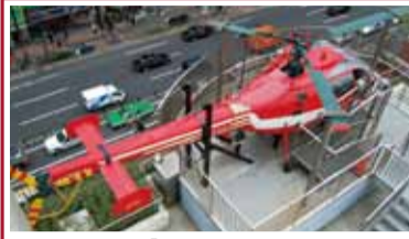
消防ヘリコプター「かもめ」は5階の屋外にあります!