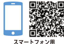
スマートフォン用