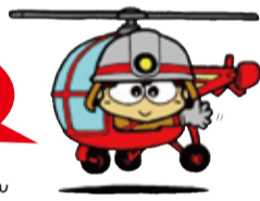
消防博物館マスコット ファイアーくん