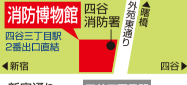
●新宿通り ●四谷三丁目駅 ●曙橋