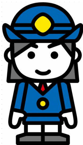
機能別団員Aさん（女性）

警戒活動をしているときに、 「興味はあったけど、きっかけがなかった。」という声に出会いました。 自分の経験も交えて広報することができ、 やりがいを感じました！