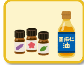
アロマオイル、動植物油