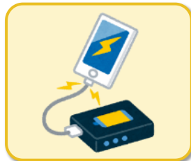
モバイルバッテリー (リチウムイオン電池)