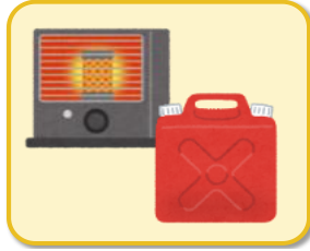
ストーブの燃料(灯油)