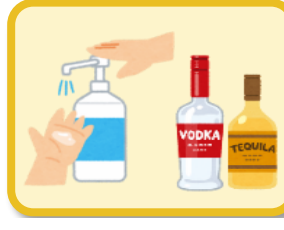
消毒用アルコール、 度数が高い酒類