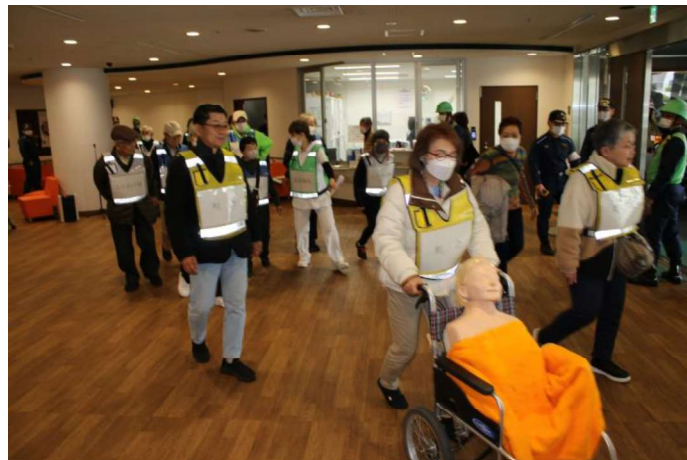
近隣住民による避難誘導