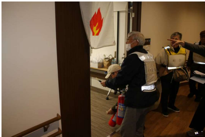
もりあげ隊による初期消火