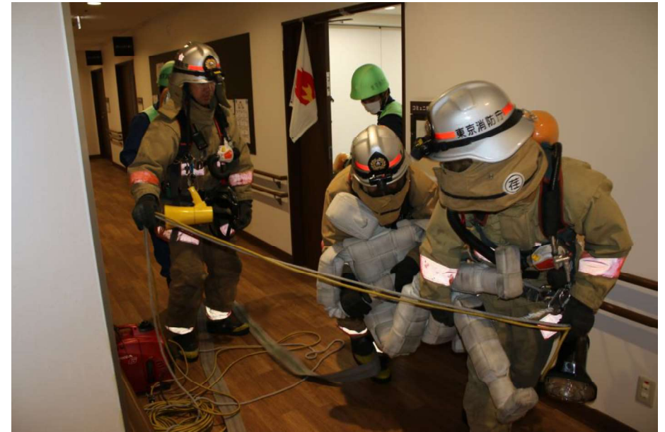
要救助者救出状況

2階居室内から火災が発生したという想定で、施設職員、施設利用者から構成される「もりあげ隊」、近隣住民が協力して発見・通報・初期消火・避難誘導を行った後、到着した消防隊が逃げ遅れた要救助者を救出する訓練を行い、相互に連携を深めることができ、有意義な消防演習となりました。