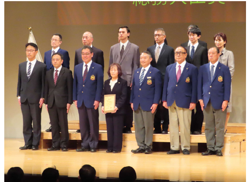
総務大臣賞を受賞された皆さまとともに