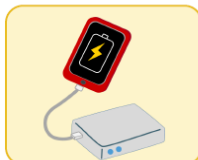
モバイルバッテリー (リチウムイオン電池)