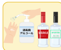
消毒用アルコール、 度数が高い酒類