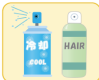
スプレー缶 (エアゾール製品)