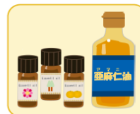
アロマオイル、 動植物油