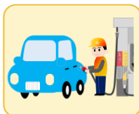
車の燃料 (ガソリン、軽油)