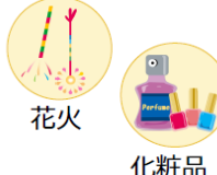
花火 化粧品 その他、危険物を含む製品はたくさんあります