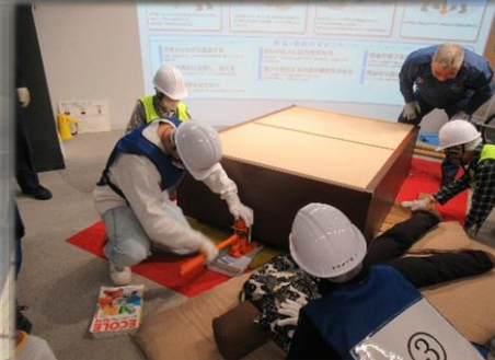
家具に挟まれた人の救助訓練