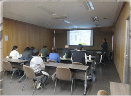
自助・共助を学ぶ講義