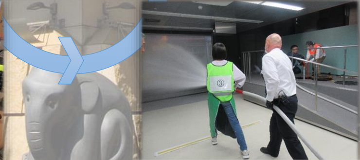
スタンドパイプを使った消火訓練