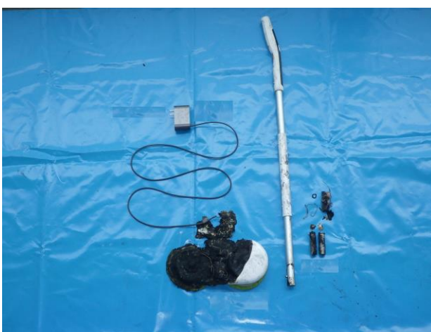
写真 6-6 焼損した電気モップの状況