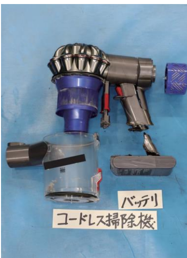
写真 13-1 焼損した機器の状況

社告・リコール情報は新聞やホームページなどに掲載され、対応方法などが示されています。使用している電化製品などが社告・リコール該当品の場合は使用を中止し、製造会社もしくは販売店に連絡して改修等を依頼してください。