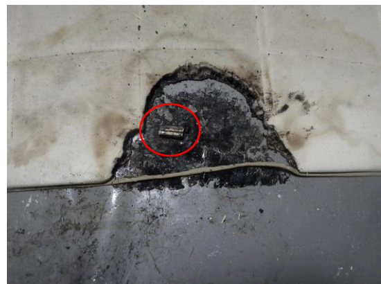
写真 4-2 出火時のライター位置