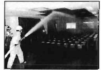
写真2 ストレート放水(仰角27°)