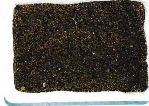
写真1-2 発酵剤を添加していない土壌