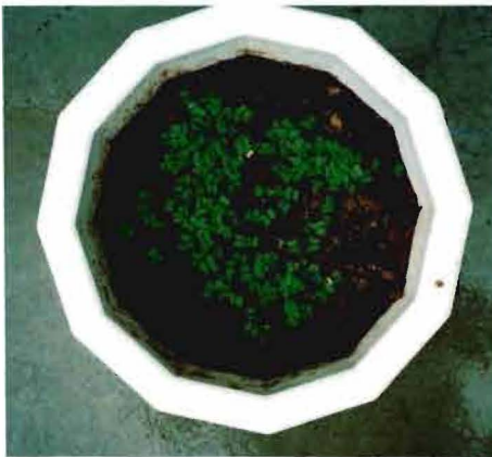
写真3-1 発酵剤を添加した土壤

と考えられる。このことは、ズダンIVで着色しなかったこと及びこまつなによる植害試験で発芽したことから土壤中にはほとんど脂肪酸が存在していないものと考えられる。