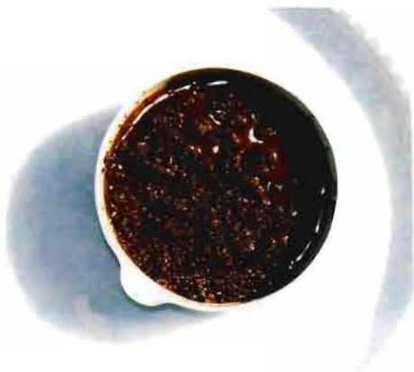
写真2-1 発酵剤を添加した土壌