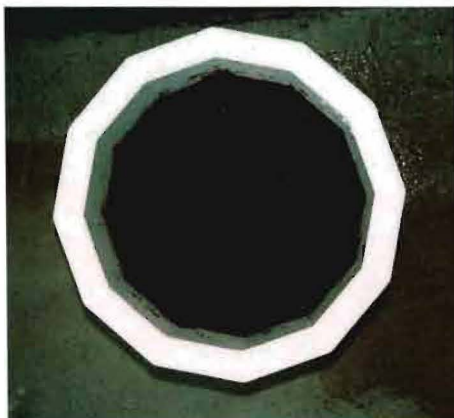
写真3-2 発酵剤を添加していない土壤