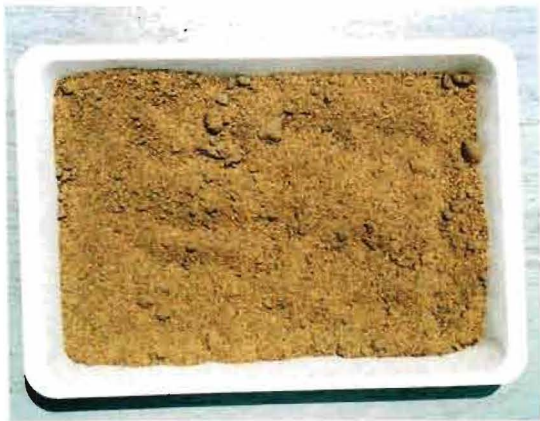
写真1-1 発酵剤を添加した土壌