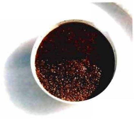
写真2-2 発酵剤を添加していない土壌