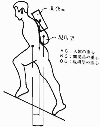
図2 開発品と現用型の背負い負担比較

開発品が人体の腰部疲労を軽減できる理由を図2によって説明すると、水のうを背負った場合、その重心が人体の重心上にくるのが最も楽で、図2のとおり開発品の方が人体の重心に近くなっている。現用型の方は、人体の重心に近づけるためにかなり腰を曲げなければならず、そのため腰部への負担が大きいのである。