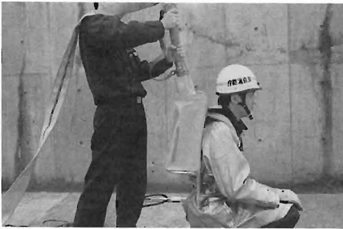
写真5 開発品への充水状況