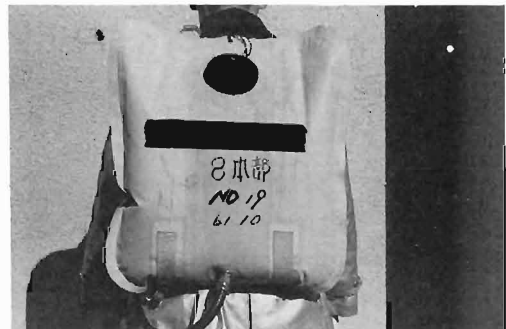
写真2 現用型の外観