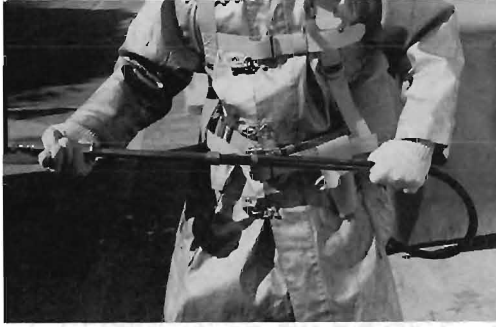
写真3 現用型ハンドポンプ