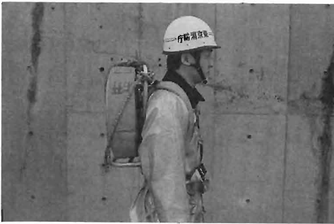
写真6 背負子による資器材積載状況

開発品が人体の腰部疲労を軽減できる理由を図2によって説明すると、水のうを背負った場合、その重心が人体の重心上にくるのが最も楽で、図2のとおり開発品の方が人体の重心に近くなっている。現用型の方は、人体の重心に近づけるためにかなり腰を曲げなければならず、そのため腰部への負担が大きいのである。