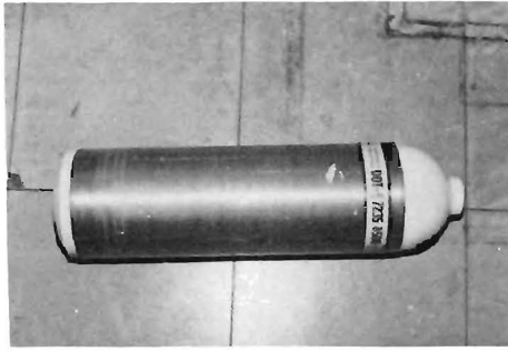
写真1 たが巻きFRPボンベ