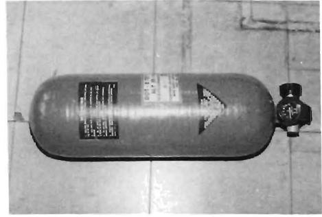
写真2 完全巻きFRPボンベ