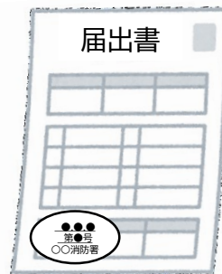
届出書の副本 (消防署の登録印付き)