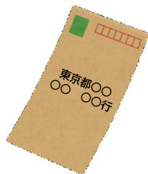
返信用の封筒 (切手付)