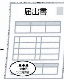
届出書の副本 （消防署の登録印付き）