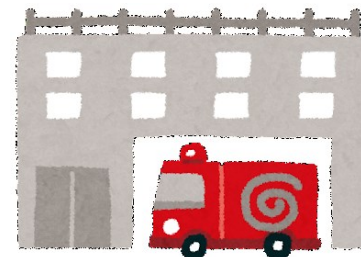
届出対象の建物を管轄する消防署 （分署や出張所の場合もあります）