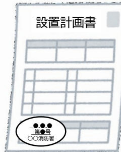
設置計画書の副本 (消防署の登録印付き)