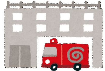
設置対象の建物を 管轄する消防署 (分署や出張所の場合もあります)