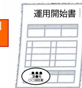
運用開始書の副本 (消防署の登録印付き)