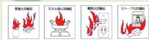
住宅用消火器の適応火災表示例