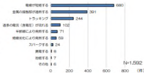
経過別の電気コード火災等件数 (平成30年～令和4年 住宅火災)