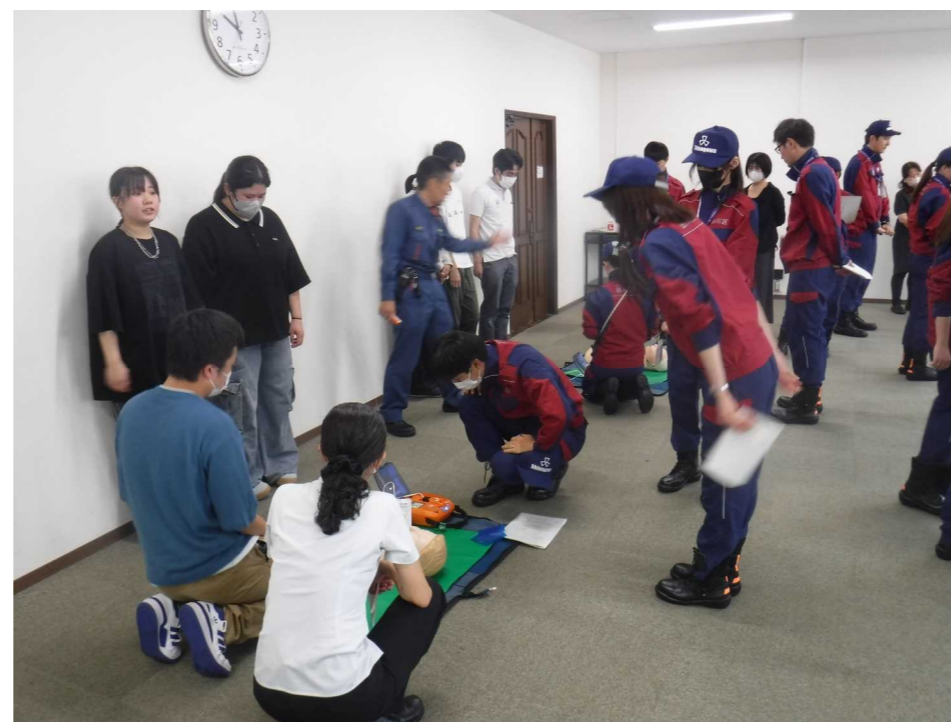
区職員も交えたAED訓練