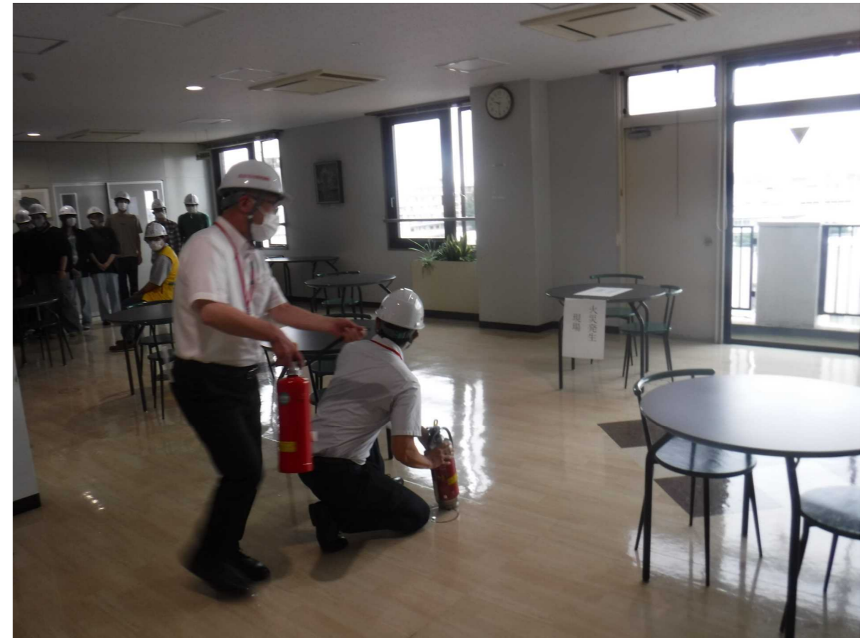
火災想定による初期消火

今回の訓練想定は、建物6階から出火し怪我人数名が発生するという内容で、自衛消防隊によるスムーズな初期消火、119番通報、避難誘導、負傷者の救護、報告が実践されていました。