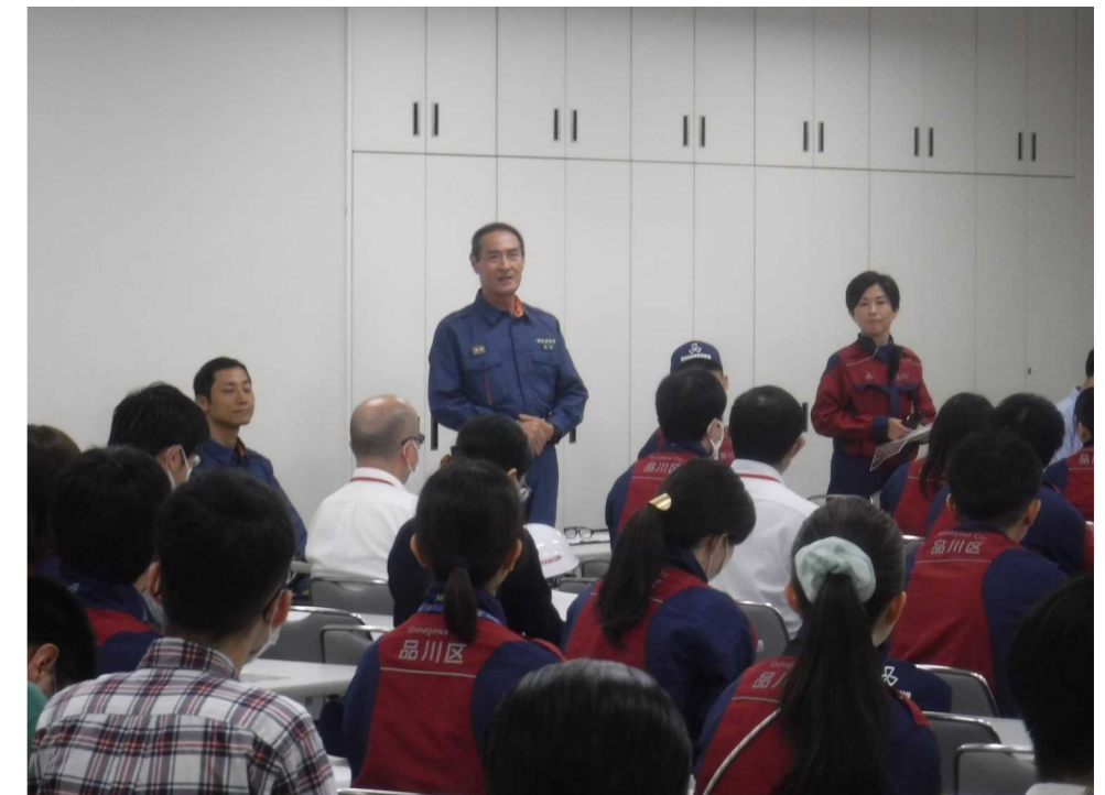
戸越出張所長による講評