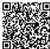
屋内消火栓の使い方 (YouTube)