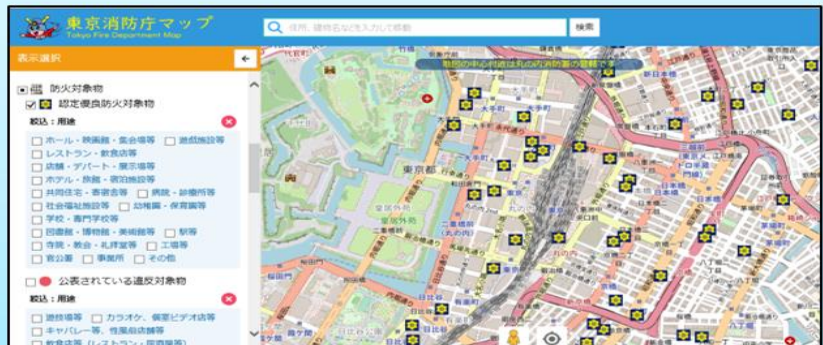
東京消防庁マップ画面（例）