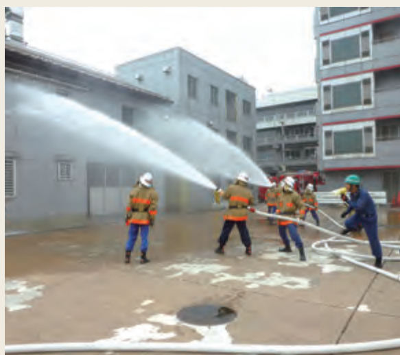
▲ 幹部教育(初級幹部科研修)

的に必要な教育訓練を行い、管理能力や指揮・統率力の向上など、必要な能力の伸長を図ることを目的として実施しています。団長、副団長を対象として管理監督