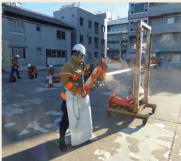
▲ 特別教育(救助科研修)