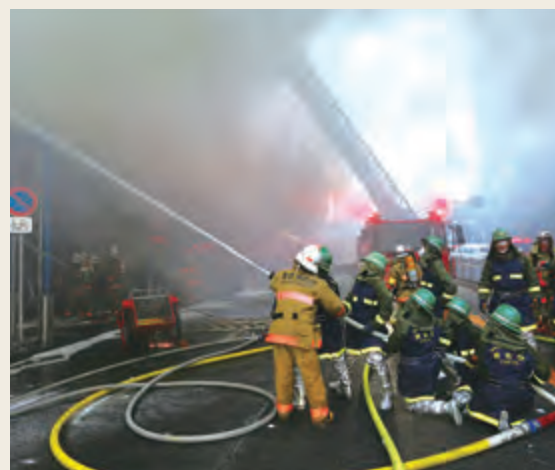
■ 図表3-1-1 消防団の現況