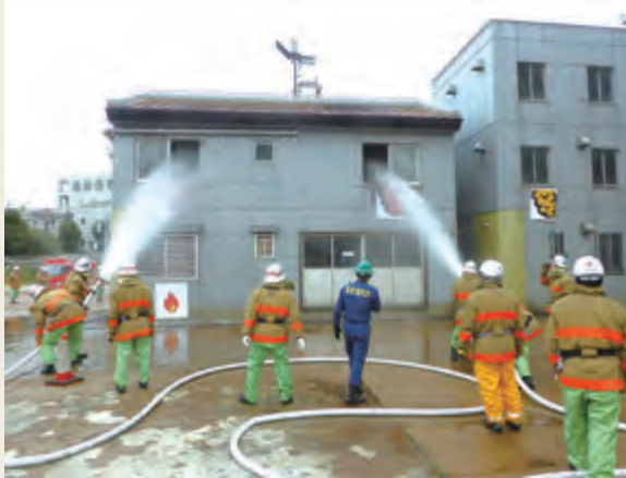
▲ 専科教育(警防科研修)