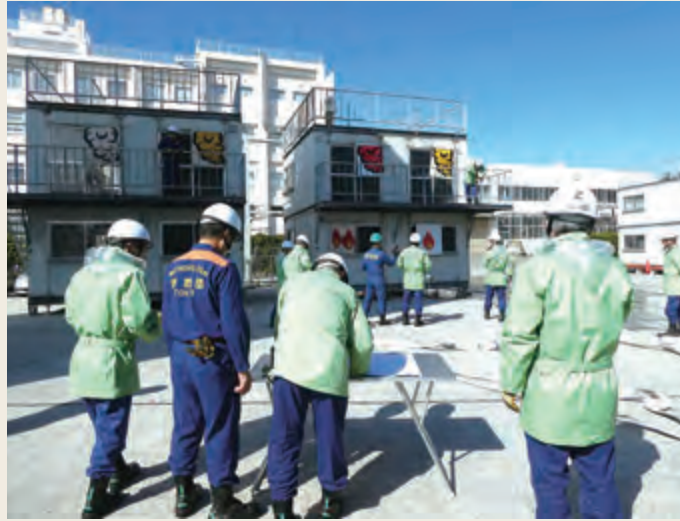
▲ 幹部教育(指揮幹部科研修)