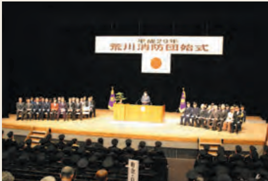
■ 図表3-1-3 特別区消防団の主な行事

新年を迎え、地域の安全を祈願するとともに、地域住民に対して消防団活動への理解を深め、あわせて火災予防意識の向上を目的として実施されるものです。