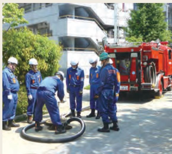
▲ 専科教育(機関科研修)