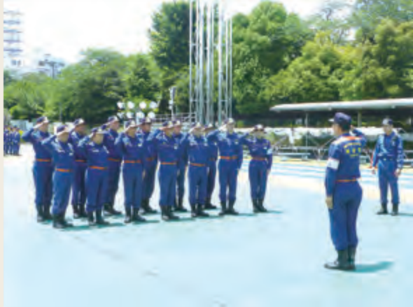
▲ 幹部教育(初級幹部科研修)