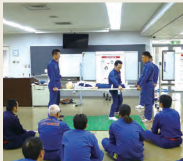
▲ 特別教育(救急科研修)