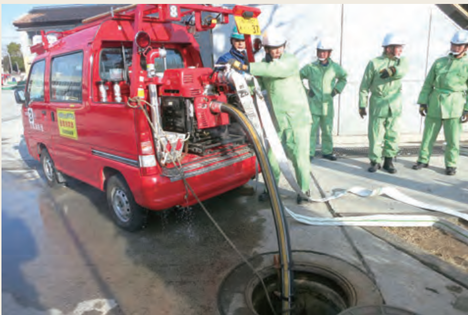
▲ 専科教育(機関科研修)