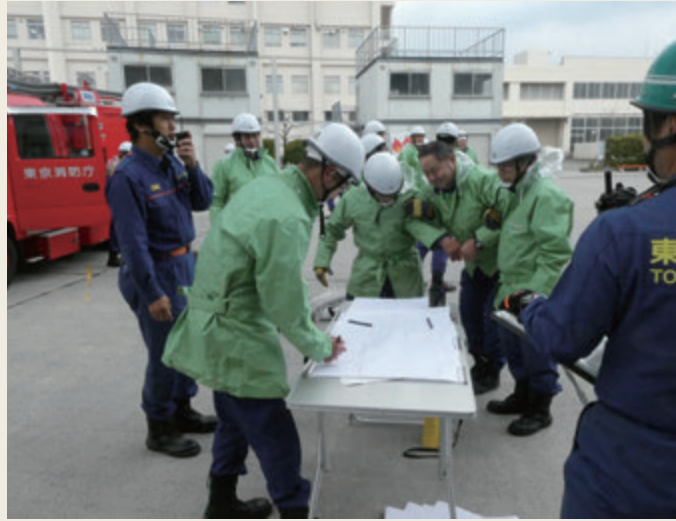
▲ 幹部教育(指揮幹部科研修)