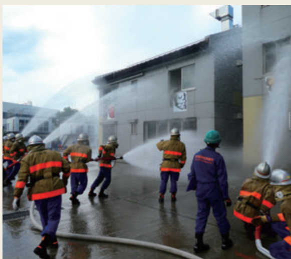
▲ 幹部教育(初級幹部科研修)

的に必要な教育訓練を行い、管理能力や指揮・統率力の向上など、必要な能力の伸長を図ることを目的として実施しています。団長、副団長を対象として管理監督