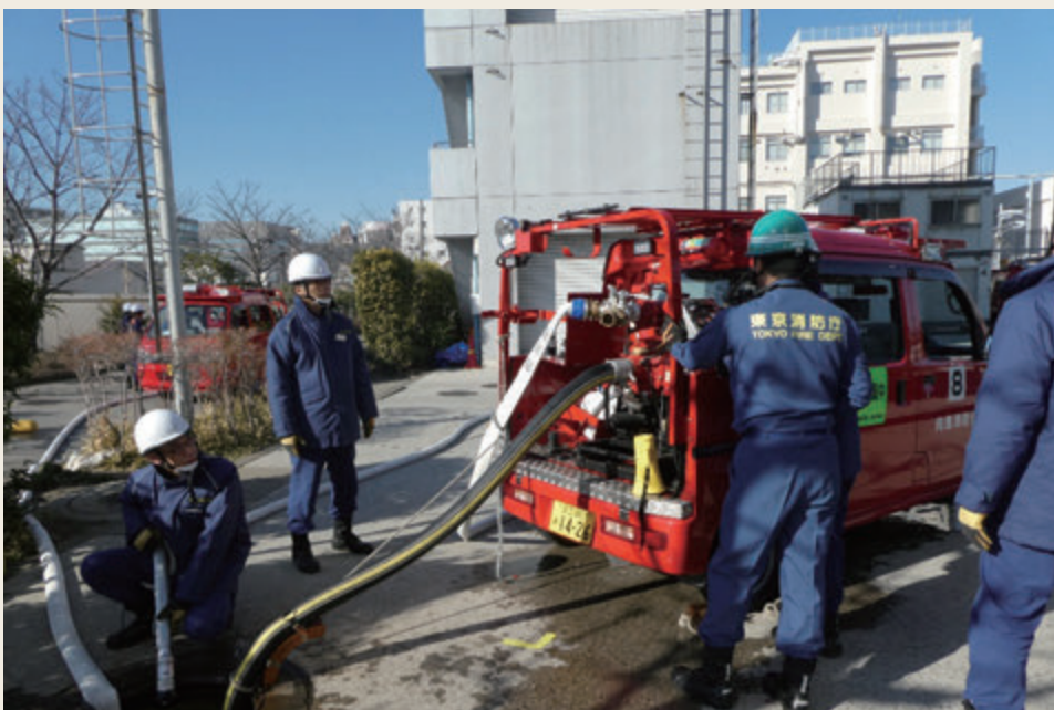
▲ 専科教育(機関科研修)