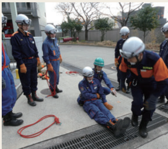
▲ 特別教育(救助科研修)