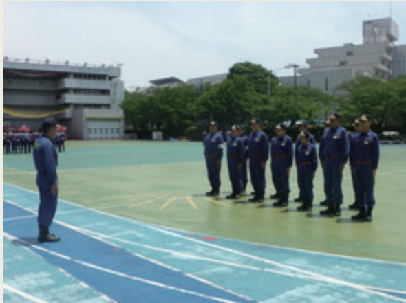
▲ 幹部教育(初級幹部科研修)