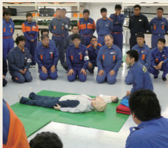
▲ 特別教育(救急科研修)