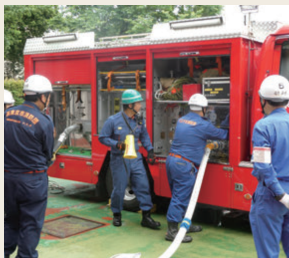
▲ 専科教育(機関科研修)