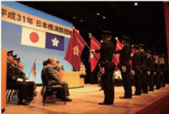
■ 図表3-1-3 特別区消防団の主な行事

新年を迎え、地域の安全を祈願するとともに、地域住民に対して消防団活動への理解を深め、あわせて火災予防意識の向上を目的として実施されるものです。