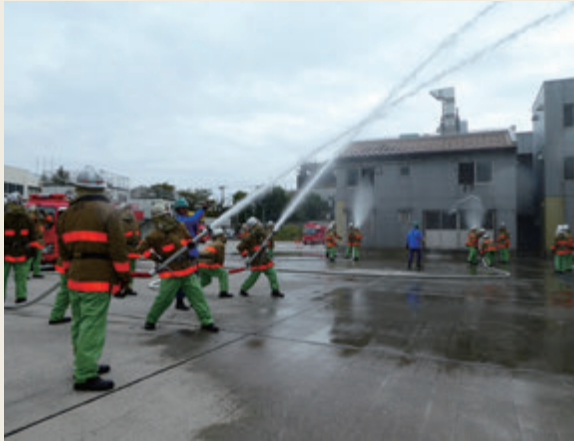
▲ 専科教育(警防科研修)