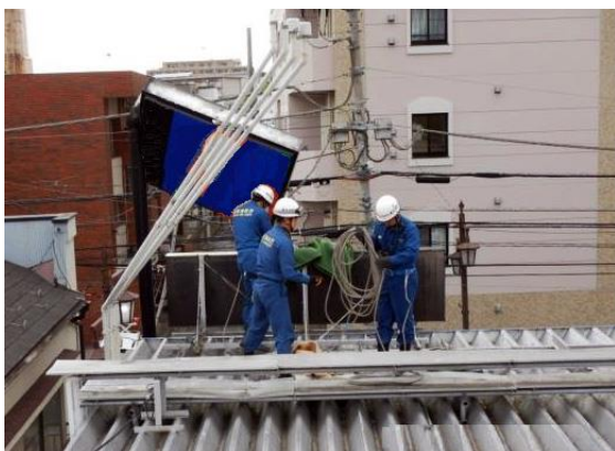
サインポールが破損した状況

「著しい損壊」とは キャノピー柱やサインポールの支柱等が傾いたり、変形し倒壊危険がある状態をいいます。