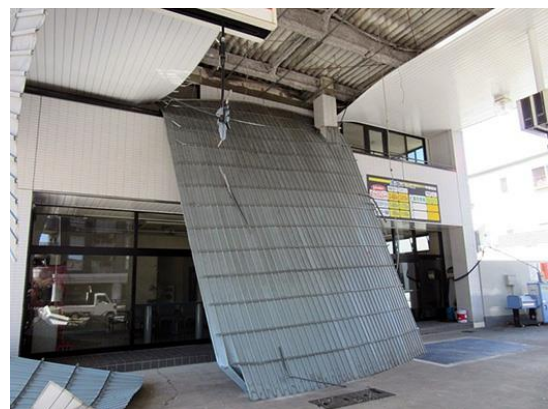
キャノピーパネルが落下した状況