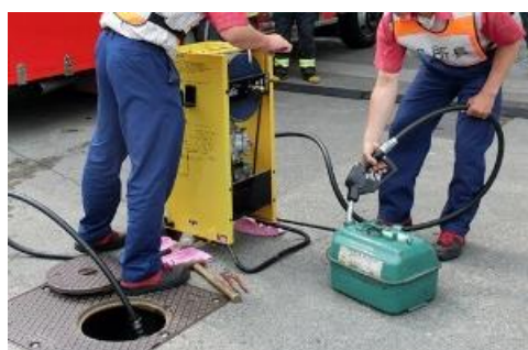
緊急用ポンプの使用例