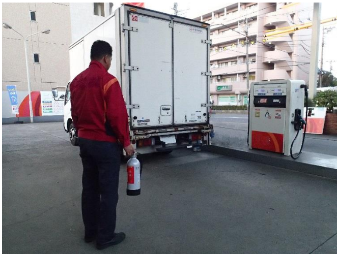
迅速な消火が行えるように消火要員を配置した例