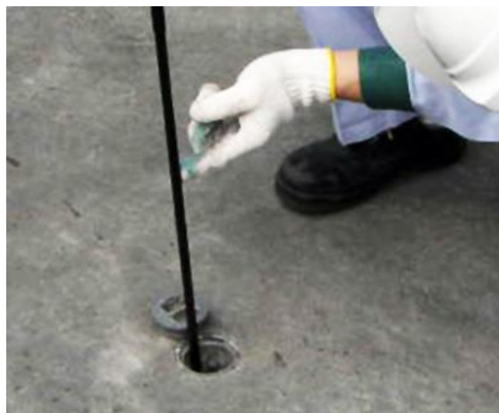
漏えい検査管に検知棒を挿入して油漏れを点検する状況