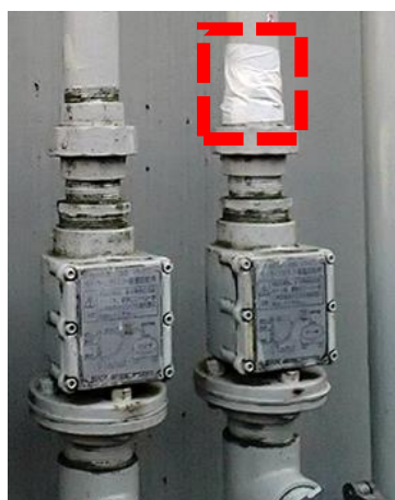
通気管の亀裂から可燃性蒸気が漏えいしないようにテープで補修した例