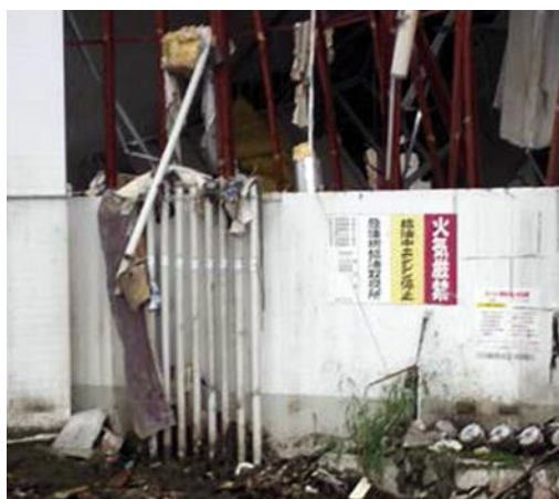
通気管が折損した状況