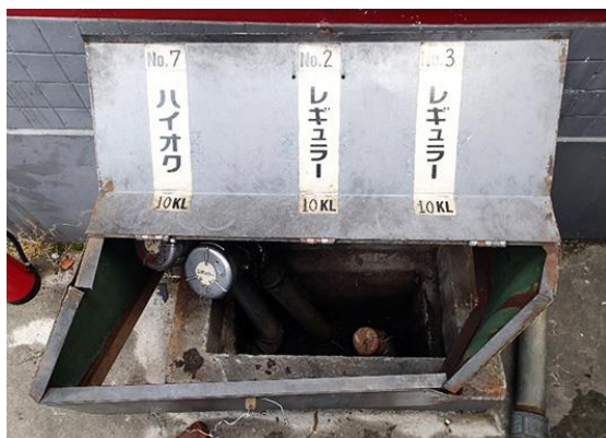
注入口ピット内の注入管が破損した状況