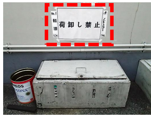
荷卸しを禁止にした例