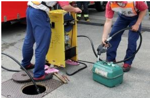
緊急用ポンプの使用例