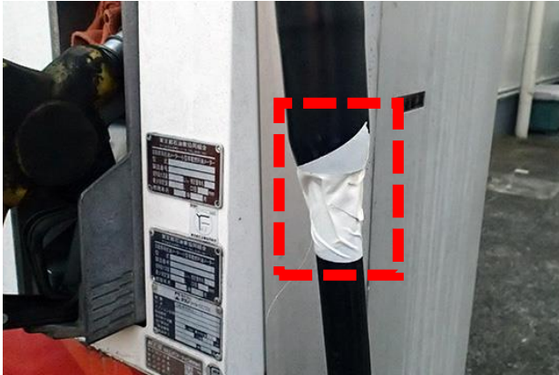
ホースを不燃テープで補修した状況