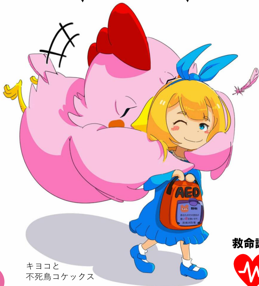
キヨコと 不死鳥コケックス