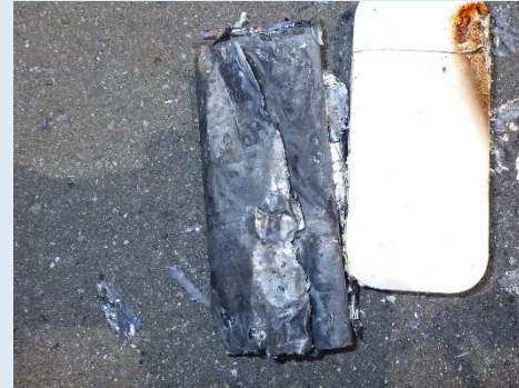
リチウムイオン電池