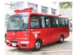
災害対応多目的車(人員輸送車)