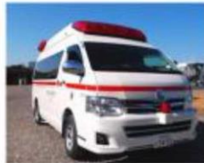
救急車(小金井救急小隊)