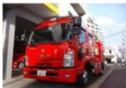
ポンプ車(小金井1小隊)