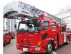
はしご車(小金井はしご小隊)