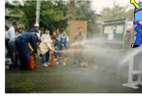
町会・自主防災会