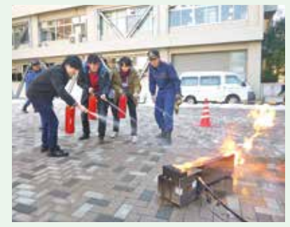
火災に備え初期消火訓練