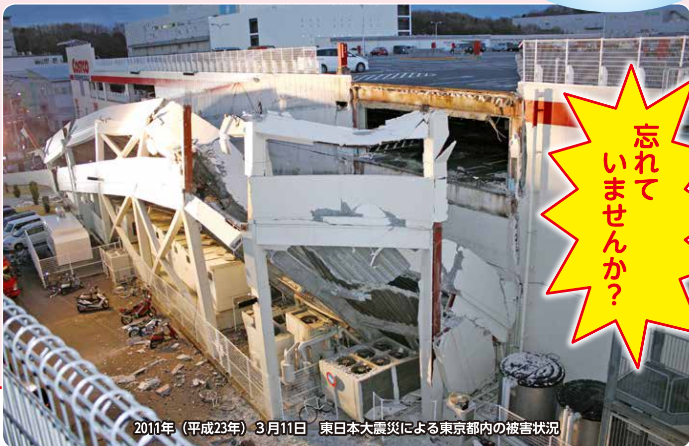
2011年(平成23年)3月11日 東日本大震災による東京都内の被害状況